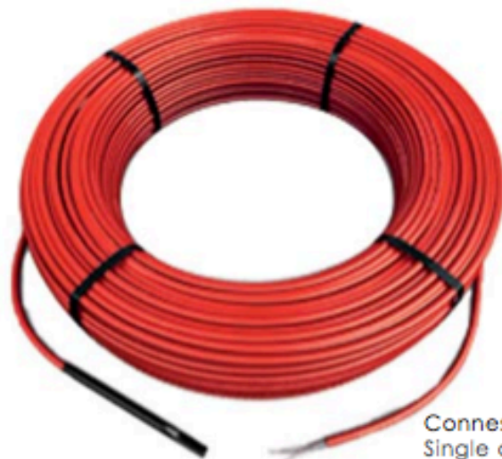
Connessione singola Single connection

Tel. +39 0424 502042 Fax + 39 0424 502043 info@lorenzoni-srl.it www.lorenzoni-srl.it